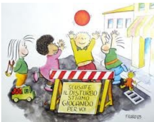
Carta dei servizi a.e. 2021/2022

Il gioco, rappresenta per il bambino la modalità principale per conoscere il mondo che lo circonda esplorandolo con tutti i sensi. Il gioco dunque è la lente attraverso cui il mondo e gli altri vengono sperimentati. Il valore del gioco nella prima infanzia (ma anche negli anni successivi) è ormai universalmente riconosciuto eppure il gioco viene ancora opposto, nei contesti educativi, alle attività: come se il primo fosse una "perdita di tempo" e le altre un "tempo di apprendimento". Ci piace pensare che l'asilo nido possa essere un luogo dove il tempo del gioco abbia uno spazio temporale alto pari almeno all'importanza che gli attribuiamo. Uno spazio non inteso solo come spazio temporale ma anche come spazio fisico adeguato e stimolante, ricco di materiali diversi che offrano al bambino la possibilità di sperimentare sensazioni e abilità differenti.